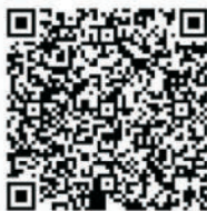
lphone APP QR code