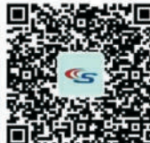
Android APP QR code for oversea customer

dear , you can download APP from the QR code, so your phone can control sauna room by the APP